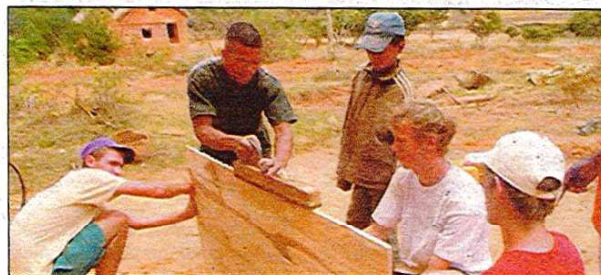
Du concret et de l'utile, comme l'aménagement de l'entrée de la maison d'une personne à mobilité réduite.