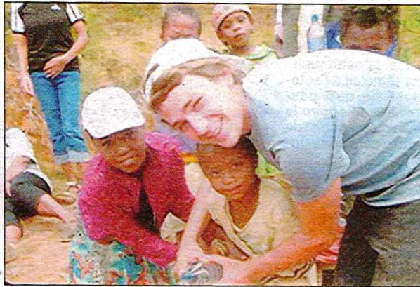
Améliorer la production du potager de la cantine de l'école, un chantier très utile mené avec la complicité des enfants.

consacrée à se familiariser avec la localité et la population, les élèves se sont mis au travail. Leur collaboration s'articulait autour d'une priorité: fournir une alimentation variée et suffisante aux enfants de l'école en tentant d'améliorer les productions du potager de la cantine par la mise en place des outils d'amélioration du sol. Avec l'aide des paysans locaux, les élèves se sont attelés à la construction d'un lombricompost d'une part, et la création d'une parcelle expérimentale d'enrichissement du sol et de paillage d'autre part. Ces deux chantiers permettant la relance de la vie du sol très pauvre et ainsi produire davantage de nourriture. Les élèves ont aussi participé à l'aménagement de l'entrée d'une maison d'une personne à mobilité réduite et à la